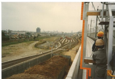
加茂宮～大成駅（現：鉄道博物館駅） 上り線建築限界検査 ※中央付近が現在の鉄道博物館