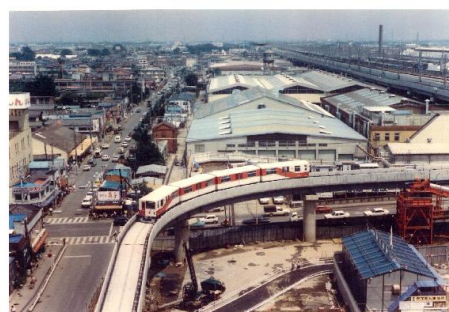
大宮駅を発車してループ線を走行する （JACKビル建設中）