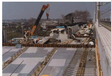
小針駅（仮称・現内宿駅）建設風景